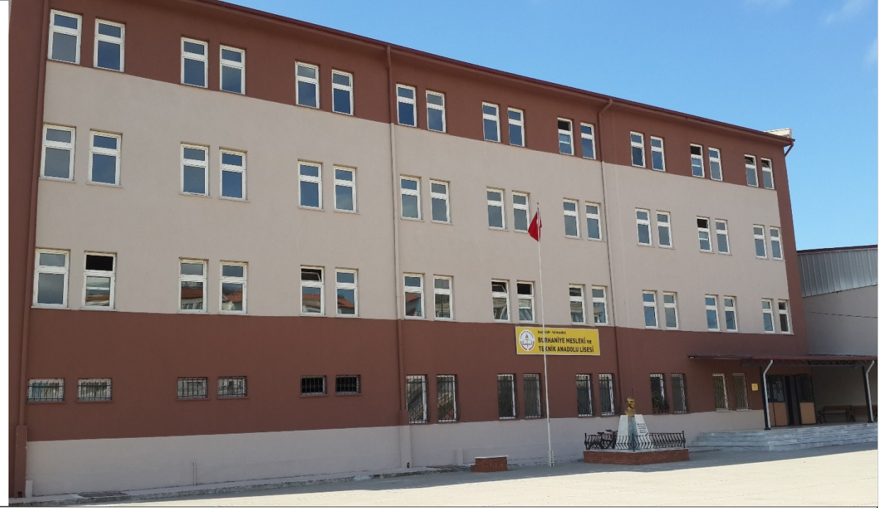
2015-2016 EĞİTİM ÖĞRETİM YILI TADİLATLAR SONRASI OKULUMUZUN GÖRÜNÜMÜ